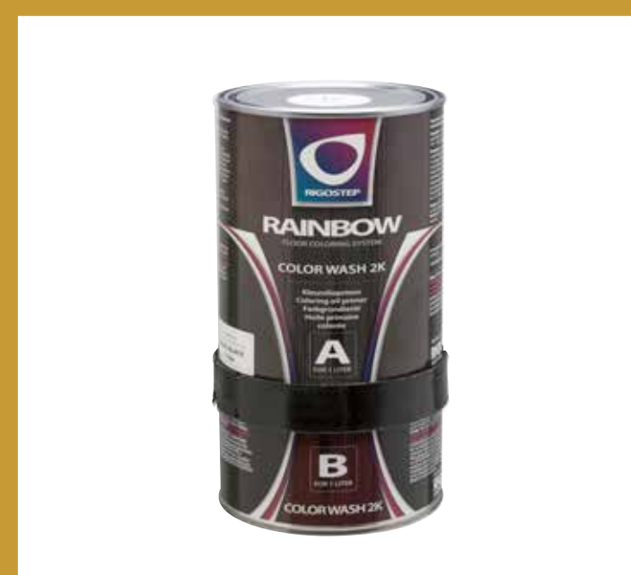
RAINBOW COLOURWASH-2K Overlakkbare kleurolievermer